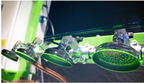
Gran ducha de superficie para el baño a manos libres