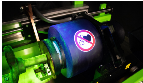
Bobinas de flujo más grandes para máxima capacidad de prueba multidireccionales

Para obtener más información sobre Universal WE, visite magnaflex.mx/Bancada-Universal-WE o comuníquese con el servicio a clientes de Magnaflex en support@magnaflex.com o al +1847-657-5300.